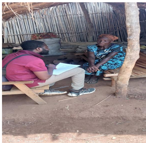
Figure 2. Photo de terrain entrain d’enquêter

La Figure 2. Donne la photo de terrain entrain d’enquêter